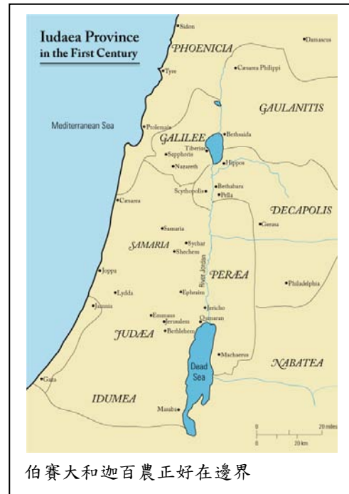
伯賽大和迦百農正好在邊界

背景：大希律(Herod the Great 74B.C.-4B.C.)於西元前 37-4 統治猶大，他死後土地被分成幾個部份，猶大和撒瑪利亞由亞基老(Herod Archelaus)所統治，他於西元前年統治到西元 6 年，因能力太差而被羅馬皇帝 Augustus 廢除，將猶大、撒瑪利亞和以土買(Idumea)地區併成猶大省(Iudaea province 是拉丁文的猶大省)，由巡撫統治。加利利則由希律的另一個兒子希律安提帕(Herod Antipas)統治，統治期間從西元前 4 年到西元 39